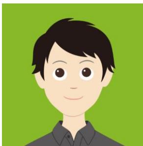
エコアクション21 環境管理責任者

この度エコアクション21の認証を取得することができました。 全社員で取り組んだ結果が評価されたことをとても嬉しく思います。 環境に対して向き合うことで 日々の業務に伴う環境に対する意識改革ができたように思います。 また、キムラシールとして社会的責任を果たすことで、 お客様からの信頼を得ることができるのではないかと考えています。 今後も『環境経営方針』のもと活動を続けていきます。