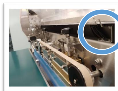
非常停止装置(フロントカバー用)